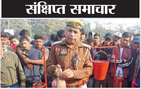
अग्निशमन एवं आपात सेवा द्वारा हिमालयन बुद्धिस्ट मार्केट में अग्नि से बचाव हेतु फायर मॉक ड्रिल व प्रशिक्षण का कार्यक्रम आयोजित किया।

एसआईटी के अलावा भी विभागीर स्तर पर 43 जांच चल रही हैं। इससे अलग शासन स्तर पर 15 मामलों की जांच की जा रही है। पांच सालों में करीब 170 से ज्यादा अधिकारी-कर्मचारियों को प्रतिकूल प्रविष्टि दी गई। सात अधिकारियों.कर्मचारियों को सस्पेंड किया जा चका है। वर्तमान में नोएडा में मुआवजा वितरण घोटाले की जांच एसआईटी कर रही है। जिसमें करीब 1000 करोड रुपए ज्यादा की वित्तीय अनियमितता सामने आ सकती है नोएडा स्टेडियम में नोएडा क्रिकेट पवेलियन सहित बनाने के लिए नोएडा प्राधिकरण की ओर से 60 करोड रुपए का टेंडर जारी किया।